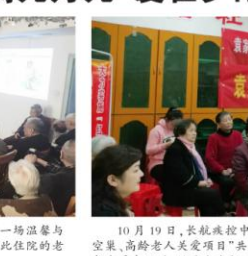
袁家社区幸福家 孝老爱亲生日会